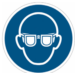
OCCHIALI (DOVE NECESSARIO)