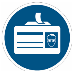
ESPORRE IL BADGE