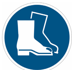
SCARPE O PUNTALI