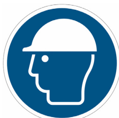
ELMETTO (DOVE NECESSARIO)